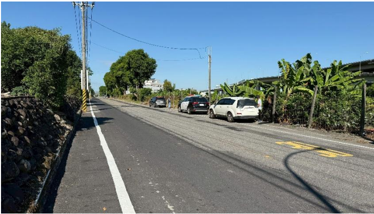
事發地點周遭環境