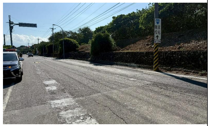
事發地點周遭環境