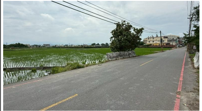
事發地點周遭環境