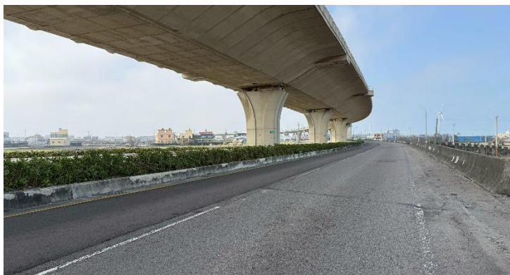
事發地點周遭環境