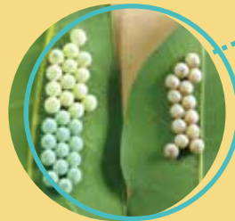
剛產之卵為鮮綠色或黃色，近孵化轉紅色

危害植物 | 以危害龍眼、荔枝、無患子及台灣欒樹等無患子科植物為主。成蟲及若蟲均以刺吸式口器吸食嫩芽、嫩梢、花穗及幼果等部位，造成落花、落果。