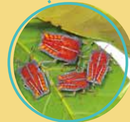
二至五齡若蟲體橙紅色