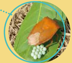
成蟲體呈盾形，黃褐色